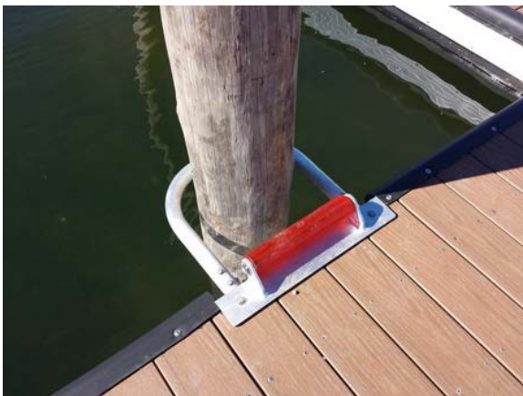
Держатель сваи с роликом

*Цена указана в долларах США, без учета доставки и растаможки