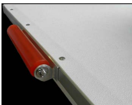
Прямая роликовая опора

*Цена указана в долларах США, без учета доставки и растаможки