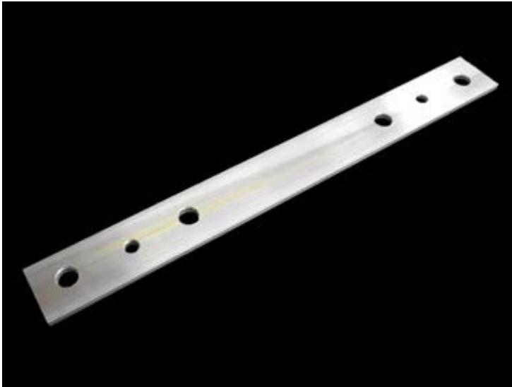
Накладка из листовой стали