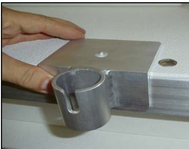
Держатель для якорной цепи