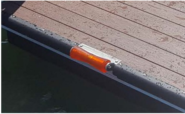
V-образная роликовая опора